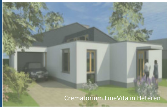
Crematorium FineVita in Heteren