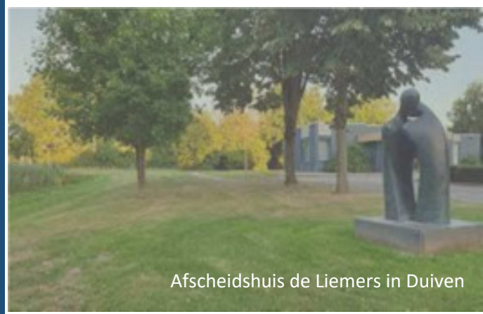
Afscheidshuis de Liemers in Duiven

Verder afspraken met crematorium of begraafplaats verzorgt Sociale Uitvaartzorg Nederland .