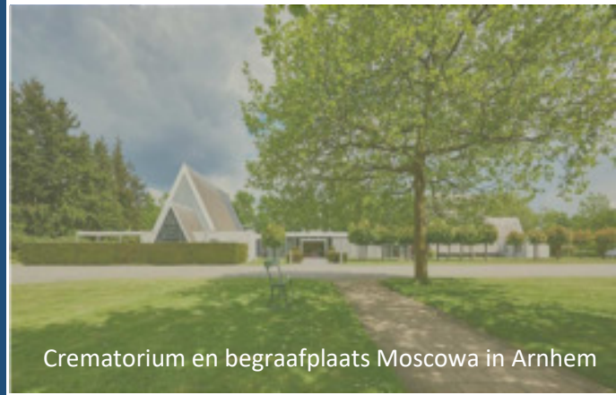
Crematorium en begraafplaats Moscowa in Arnhem